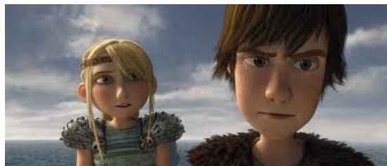
Reference for character design

אורי : ילד רגיש ומופנם בן 14, ממורמר על המציאות סביבו, ציני ואגואיסט, משתיק את הרעש הפנימי ע"י אביזרים חיצוניים, צרכן כפייתי של תחליפי מציאויות, בורח למחשב, חי בסרט, מוקף מסכים של אדישות. הולך ברחוב עם אוזניות גדולות, מנותק מהעולם. הורים גרושים, חי עם אמא שלו ואחיו הקטן בן ה 8. אבא שלו שחקן או אומן (הם נפגשים לפעמים ולא מצליחים לדבר). אמא שלו מורה ליוגה, אוכלת בריא, ניואייג'ית. רק שירה מצליחה לפתוח את לב האבן שלו. אורי הוא הגיבור שעובר את השינוי.